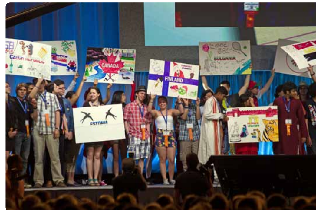
Intel ISEF kilpailuun osallistuu vuosittain lähes 1600 nuorta reilusta 70 valtiosta – se on ainutlaatuinen mahdollisuus tehdä tuttavuuksia ympäri maailman.

Kun pääsee esittämään työtä johonkin tiedekilpailuun, voi olla varma, että kaikilla kilpailuun osallistuvilla on jotain yhteistä: he ovat kiinnostuneet asioiden tutkimisesta ja he ovat uteliaita. Kilpailu on siis oivallinen paikka luoda tuttavuuksia jopa ympäri maailman. Moni kilpailu on rakennettu siten, että oman alueen kilpailusta pääsee jatkoon valtakunnalliseen kilpailuun ja sieltä on mahdollisuus päästä eteenpäin kansainvälisiin kilpailuihin.