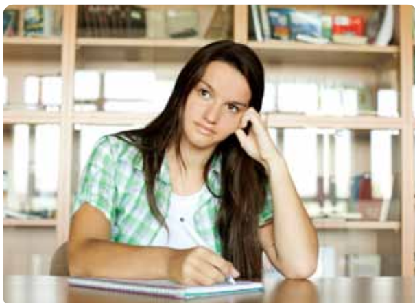
Tutkimus ei ole aina pelkkää tekemistä. On hyvä käyttää aikaa myös ajattelemiseen.

Kilpailutilanteessa voi löytää itsestään uusia puolia – sellaisia tietoja ja taitoja tai luonteenpiirteitä, joita ei tiennyt olevan olemassa. Samalla osallistuminen kehittää itseluottamusta ja auttaa hyväksymään oman itsensä kaikkine puutteineen.