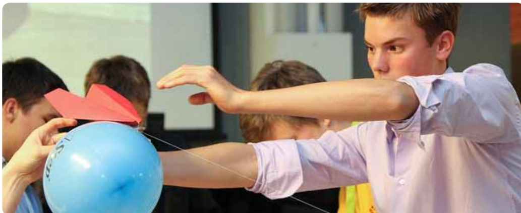
Projektit ovat oiva tapa harjoitella ryhmätyöskentelyä.

☛ Raportointi: Raportissa kerrotaan mitä on tehty, ja onko asetetut tavoitteet saavutettu sekä mihin lopputulokseen päästiin tai mitä kehitettiin. Hyvä raportti on selkeästi jäsen- nelty ja johdonmukaisesti etenevä kokonaisuus.