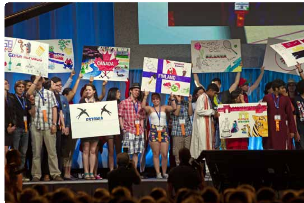
Intel ISEF kilpailuun osallistuu vuosittain lähes 1600 nuorta reilusta 70 valtiosta – se on ainutlaatuinen mahdollisuus tehdä tuttavuuksia ympäri maailman.

Kun pääsee esittämään työtä johonkin tiedekilpailuun, voi olla varma, että kaikilla kilpailuun osallistuvilla on jotain yhteistä: he ovat kiinnostuneet asioiden tutkimisesta ja he ovat uteliaita. Kilpailu on siis oivallinen paikka luoda tuttavuuksia jopa ympäri maailman. Moni kilpailu on rakennettu siten, että oman alueen kilpailusta pääsee jatkoon valtakunnalliseen kilpailuun ja sieltä on mahdollisuus päästä eteenpäin kansainvälisiin kilpailuihin.