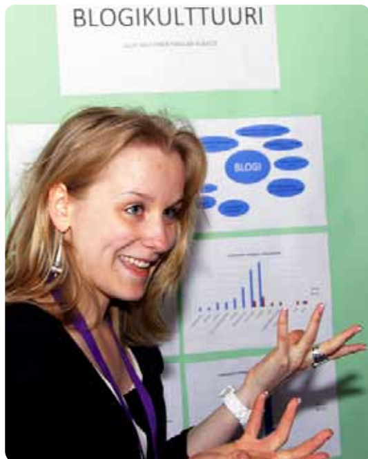
Avoimuus, innostuneisuus ja iloisuus saavat kuulijankin innostumaan ja kiinnostumaan työstäsi.

Sanonta ”yksi kuva kertoo enemmän, kuin tuhat sanaa” pätee myös posterin kohdalla. Kaikkiin kuviin liitetään selittävä kuvateksti ja mainita joko kuvan yhteydessä tai marginaalissa kuvien tekijästä/tekijöistä. Tekijää ei yleensä tarvitse mainita jos kuvat ovat työn tekijän omia. Jos kuvissa, videoissa tai esityksissä on muita ihmisiä, on hyvän tavan mukaista pyytää heiltä lupa esitykseen. Kuvissa tai esityksissä ei saa olla mitään loukkaavaa, eikä ketään fyysistä tai aineellisen merkin omistajaa saa loukata (hyvä tapa on, että posterilla ei mainosteta sponso-reita tai kaupallisia tuotteita). Eri värien ja fonttien käyttö on suositeltavaa, mutta kummassakin kolmea voi pitää optimina.